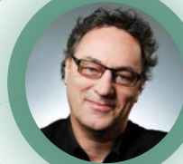
Gerd Leonhard TOWARDS EXPONENTIAL GROWTH